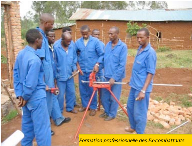
Formation professionnelle des Ex-combattants

Les formations professionnelles offertes aux XCs par les partenaires du PRDR sont entre autres la plomberie, la maçonnerie, la menuiserie, l'électricité, la mécanique, la couture, l'hôtellerie, etc. Des cours d'économie et d'entrepreneuriat sont offerts en complément.